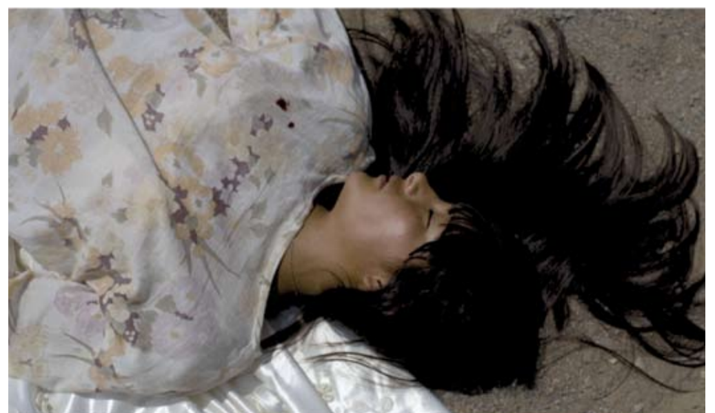
Der Muttertod stürzt Faustas Leben um.