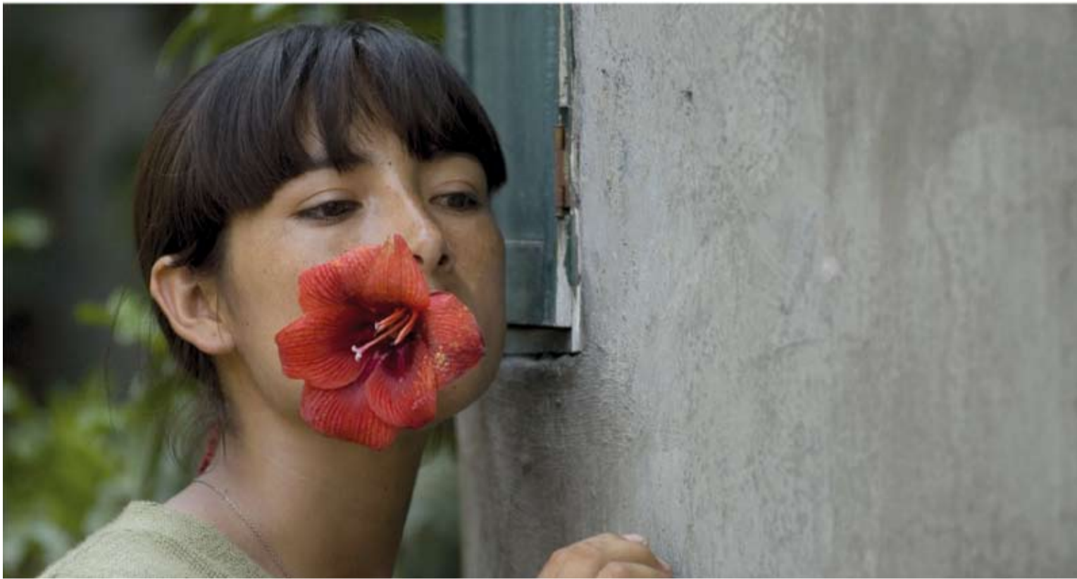
Naturwüchsig ist hier nichts: die Metapher nicht und auch nicht die authentische Protagonistin Magaly Solier.