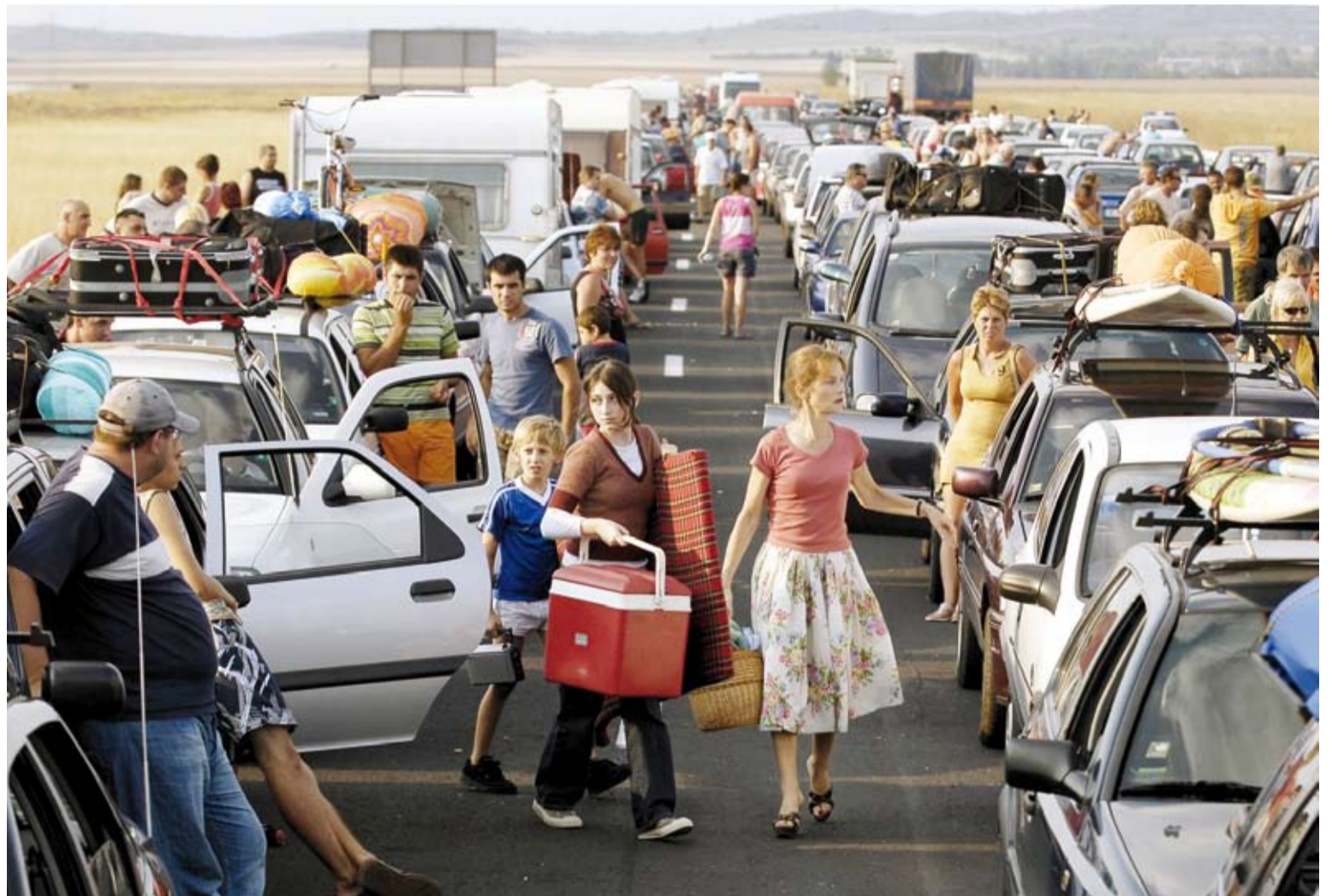
Isabelle Huppert bahnt sich stoisch ihren Weg durch die neue Nachbarschaft.

Und dabei sind die beiden besten Rollen noch gar nicht erwähnt worden. Isabelle Huppert spielt Michels Frau Marthe, eine Hausfrau, die mit stoischem Vertrauen in die Eintönigkeit des abgeschiedenen Lebens ihre frisch gewaschene Wäsche in den ewigen Sommer hängt. Alles Hypernervöse der Huppertschen Darstellungskunst ist hier gebändigt und doch jederzeit parat zum Ausbruch – das Wunder in Home ist, dass es nie dazu kommt, und Anläs-