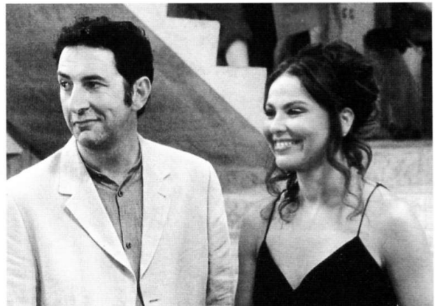
François Morel, Ornella Muti