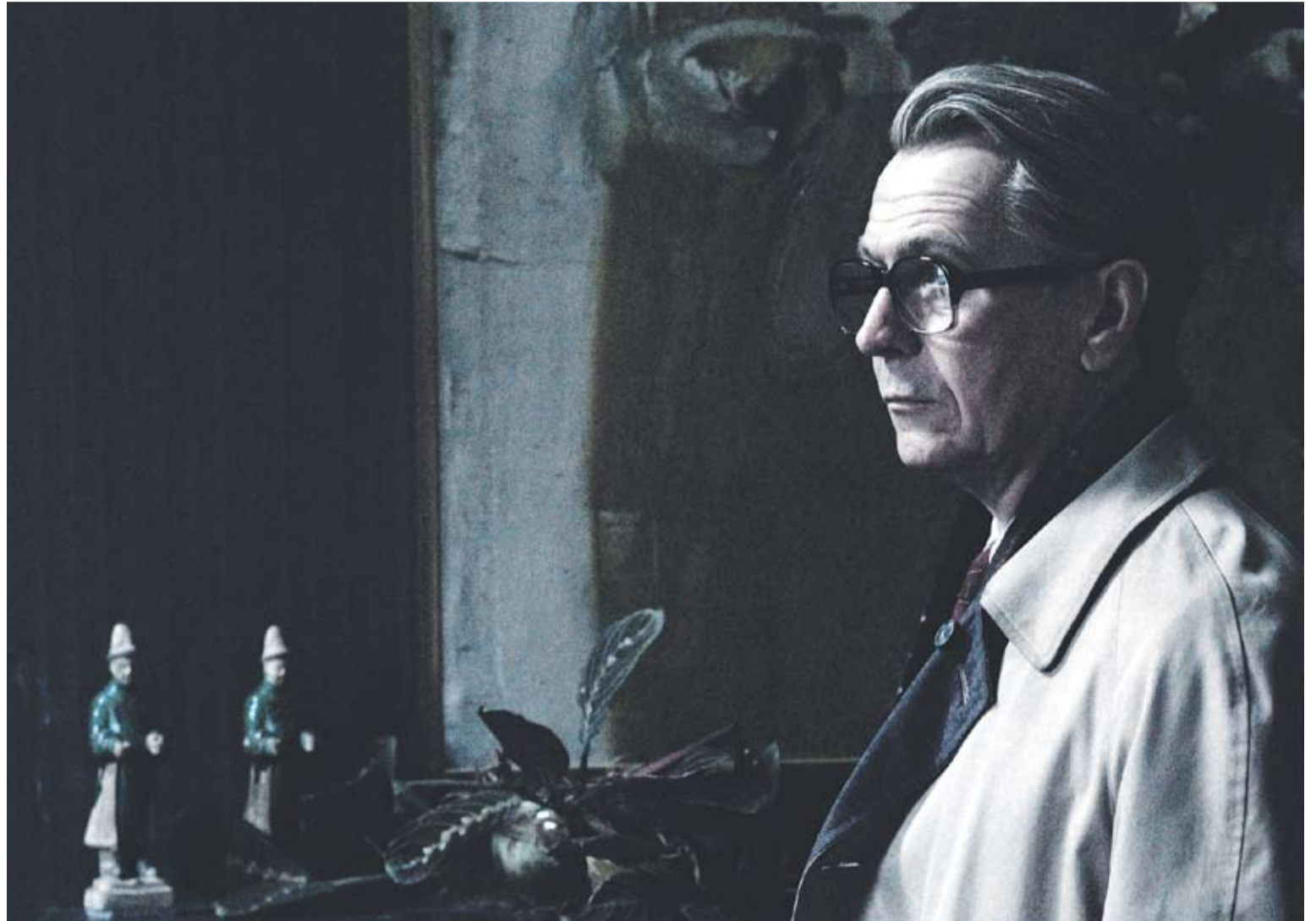
Endlich wieder eine würdige Hauptrolle: Gary Oldman als Meisteragent George Smiley.

Es war sehr merkwürdig. Die meisten Kostümfilm spielen entweder in der Zukunft oder in einer Fantasiewelt oder in einer lange zurückliegenden Zeit. Aber eine Geschichte über eine Ära zu drehen, die man selbst erlebt und an die man sich erinnern kann, war sehr eigenartig. Man fühlt sich plötzlich so alt. Es passierte mir mehrmals, dass ich