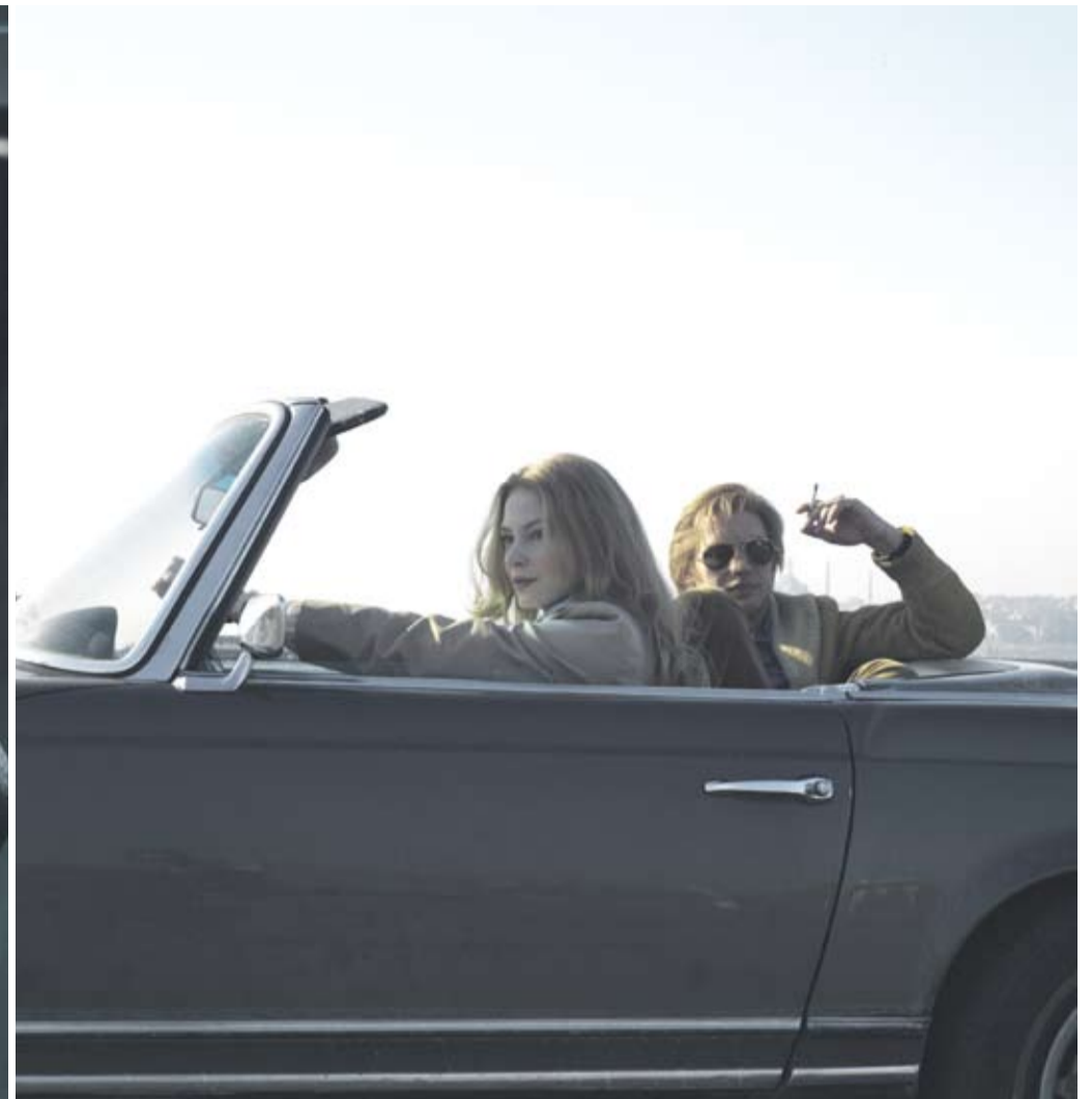
Temperamente, gezügelt, ungezügelt: Colin Firth und Tom Hardy in „Tinker Tailor Soldier Spy“.