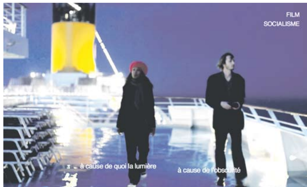
„Titanic“ im Mittelmeer: „Film Socialisme“

Wir schweben darauf mit Morton Feldman. / Wir sind darin Strukturen wie die Farbsplitter, Spritzer und Klumpen / in den Schüttbildern