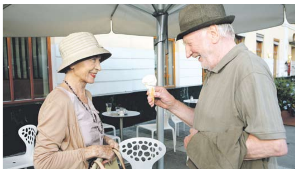
Österreichweit: „Anfang 80“ mit Christine Ostermayer und Karl Merkatz. „Ein ausserordentlicher Film, hinreißend gespielt.“ (FALTER).