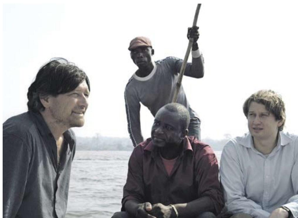
Silberner Bär der Berlinale 2011: „Schlafkrankheit“ von Ulrich Köhler: Auf den Spuren von Joseph Conrads „Heart of Darkness“...