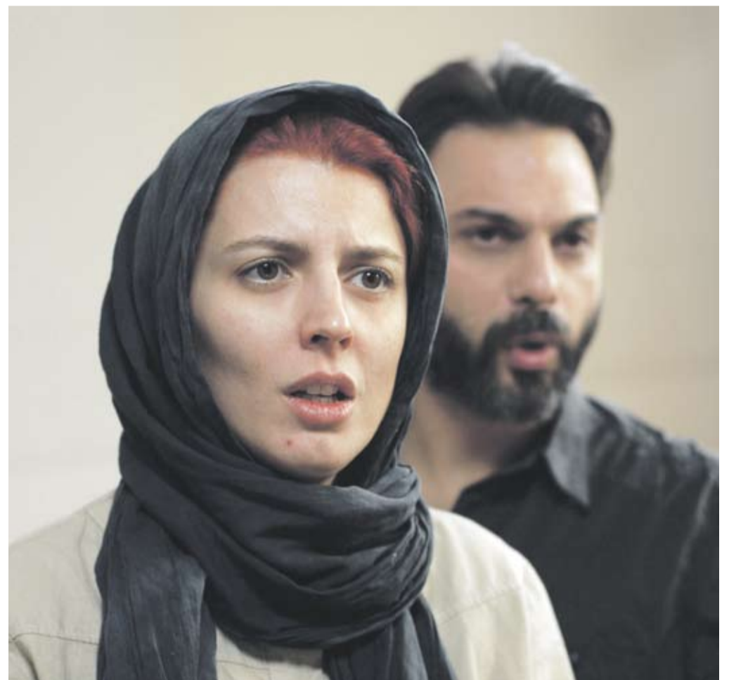
Goldener Bär der Berlinale 2011: „Nader und Simin“.