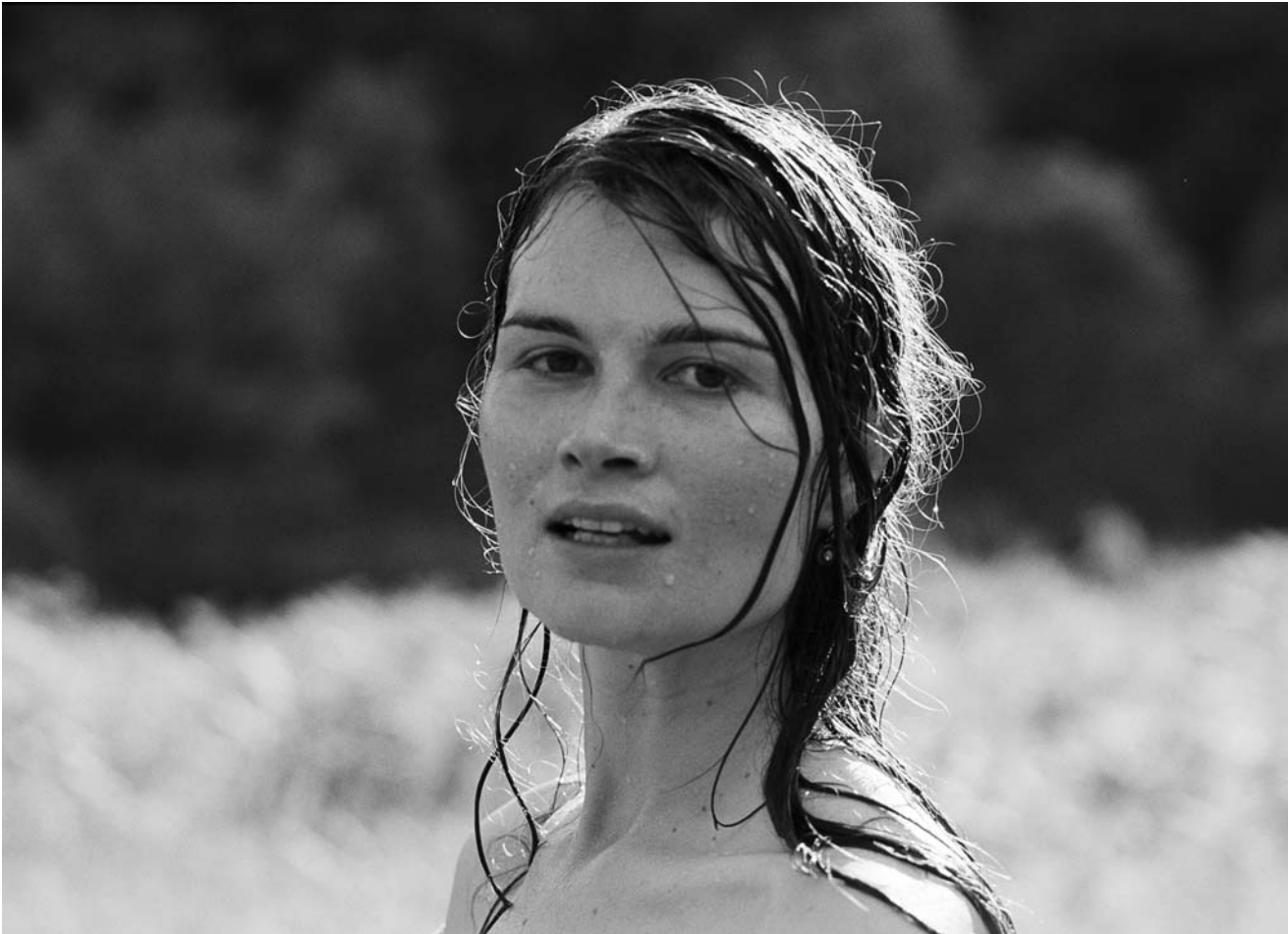
LADY CHATTERLEY von Pascale Ferran, ab 1. November 2007