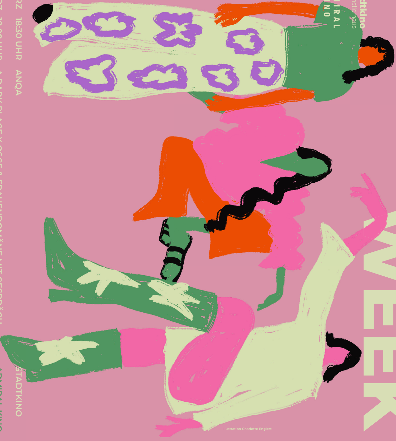
Illustration Charlotte Englert